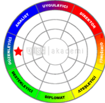
Ortama Uyarlanmış Karakter Tipi Düzenleyici

DOĞAL ile ORTAMA UYARLANMIŞ KARAKTER ARASINDAKİ FARK: Yok