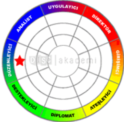
Doğal Karakter Tipi Düzenleyici